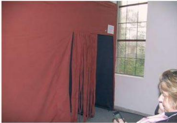
Ein Zelt zur Bekehrung des Paulus (3 x 3 m). Ein schmaler labyrinthartiger Gang führt ins Innere, in dem das Lichterlebnis des Paulus nachempfunden werden kann.

Im Spiel Gemeinde symbolisieren vier Kegel vier Gesellschaftsschichten: Ablehnung und Zustimmung zu den Worten des Paulus bewirken die Ziehrichtung der Figuren. Das weiße Feld in der Mitte, das im Gleichgewicht gehalten werden soll, symbolisiert die Kirche. Der Schritt hinein ist die Taufe.